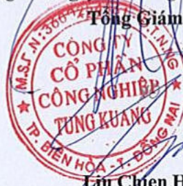
Lưu Chiên Hưng